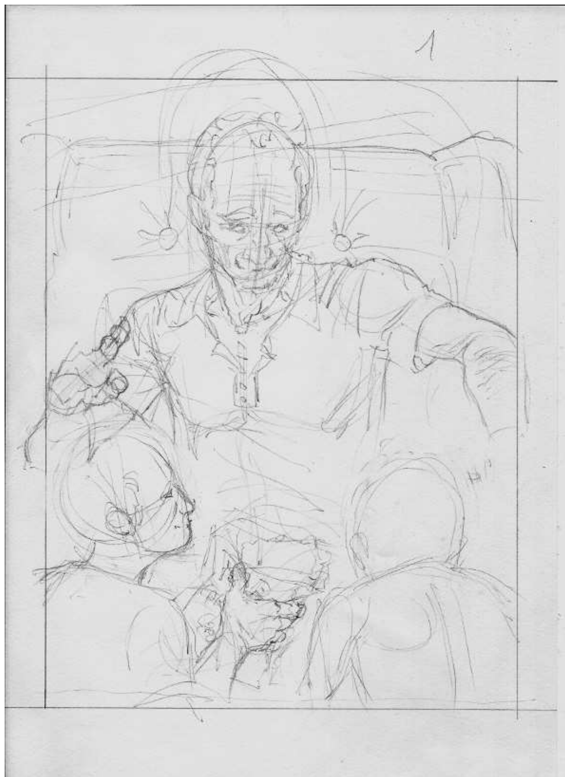
Schizzi di Daniele Del Grosso.